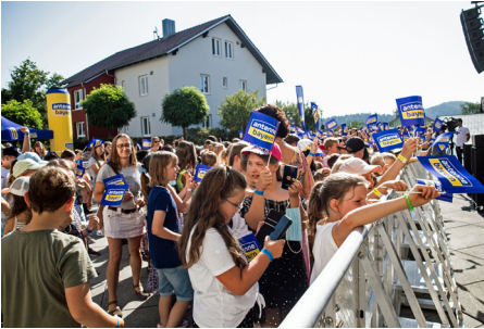
Die Schülerinnen und Schüler waren begeistert