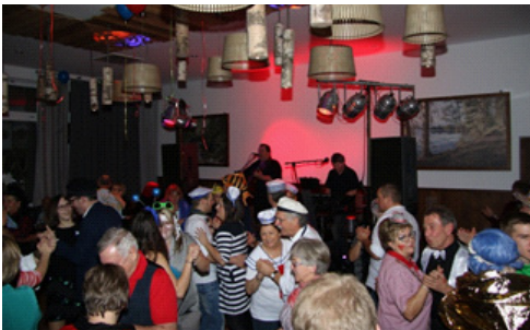
Alle „Faschingsnarren“ sind beim Fürstensteiner Pfarrverbandsball willkommen!

Fürstenstein. Nach zwei Jahren Pause lädt der Pfarrgemeinderat Fürstenstein ganz nach dem Motto „Endlich wieder kunterbuntes Faschingstreiben“ zum traditionellen Pfarrball ins Gasthaus Kerber in Fürstenstein ein. Für die musikalische Stimmung sorgen heuer die „Strouh Huat Buam“ mit einem fetzigen Programm für Jung und Alt. Die Besucher erwartet wieder eine große Tombola mit tollen Sachpreisen. Neben lustigen Showeinlagen dürfen sich die Besucher auf einen Auftritt der Teenie-Garde & Showtanzgruppe Zenturia aus Schöllnach freuen. Beginn ist um 19:30 Uhr. Tische können vorab im Gasthof Kerber unter 08504/1645 reserviert werden (Reservierungen gelten nur bis 20 Uhr). Der Eintritt kostet 8€.