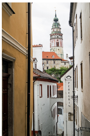
Eine der malerischen Gassen der Stadt

Hauses. Unweit davon Haus Nr. 152. Hier befindet sich das Bezirksheimatmuseum. Die Museumssammlungen zeigen die Entwicklung der Region von der Urzeit bis ins 20. Jahrhundert. Besonders erwähnenswert ist die barocke Apotheke, die aus der Zeit des Kollegs erhalten geblieben ist. Es folgt ein „Kleiner Platz“ Na Louzi. Hier befindet sich ein Wachsfiguren-Museum, dass 2001 eröffnet wurde. Weiter die Siroka-Straße mit vielen erwähnenswerten Häusern. Der nächste Höhepunkt ist das Haus Nr. 70-72 mit dem Egon Schiele Art Centrum. Dieses ehemalige städtische Brauhaus birgt eine ständige Ausstellung von Aquarellen und Zeichnungen des Malers. Seine Mutter stammte aus Krumau. Erwähnenswert wäre noch das Kloster der Kreuzherren mit dem roten Stern sowie die Synagoge. Schloss und Burg mit den reichhaltigen Details und Einrichtungen würden eine seitenlange Beschreibung benötigen. Die Seite soll nur einen kleinen Vorgeschmack auf die Stadt an der Moldau geben. Es gibt einen neuen Stadtführer mit der ISBN-Nr. 978-80-904124 zum Preis von umgerechnet etwa 10 Euro. Dieser ist sehr ausführlich.