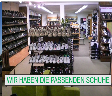
WIR HABEN DIE PASSENDE SCHUHE