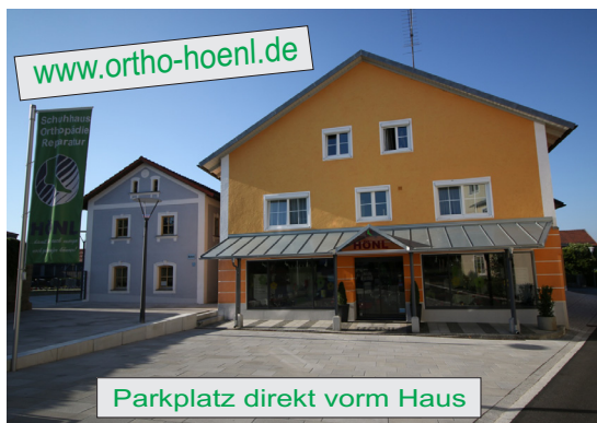
Parkplatz direkt vorm Haus