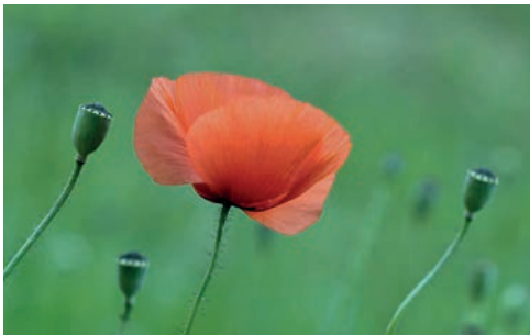
Mohnblüte im Wind

Er versucht in seinen Fotografien und Gedichtstexten Erlebnismomente aus unserer umliegenden Landschaft und Natur festzuhalten, aus ihr interessante Dinge sichtbar zu machen und im Bild zu bewahren. Dabei entstehen Erlebnismotive aus unserer Heimat, die eine ganz besondere Aussage- und Strahlkraft haben. Sie vermitteln Eindrücke mit gedanklichen und visuellen Effekten, die einer engen Verbindung von Natur und Mensch intensive Aufmerksamkeit geben. Sie nehmen in Respekt vor der Natur „sensible Blicke“ in eine Welt auf, deren Schönheiten, Farb- und Formwirkungen wir oft viel zu wenig wahrnehmen. Pflanzen und Tiere in der Nahansicht, Lichtstimmungen und Blickwinkel führen uns in ein Wunderland der Natur, die in „Augenblicken“ erfahrbar wird und unser Staunen erweckt. Sie laden ein, spannende und interessante Momente aus unserer Umwelt aufzufassen und zu verinnerlichen. Sie wollen zum feinen Nachspüren anregen und uns in einen wunderbaren, sehr nahe liegenden kleinen Kosmos führen. Die letzten beiden veröffentlichten Bild-Textbände : Perlen der Zeit (2020) / ISBN 978-3-947688-05-0 u. Roter Mohn (2022) / ISBN 978-3-9821924-3 Erhältlich in allen Buchhandlungen sowie beim Autor (portofreie Zusendung): . e-mail: dr.haselbeck@web.de