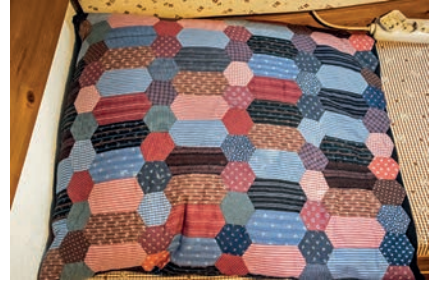
Eine ihrer ersten Arbeiten vor über 50 Jahren

Kultur im Dreiburgenland“ im Rathaus Tittling Ende letzten Jahres war sie auch wieder mit einigen ihrer Arbeiten vertreten.