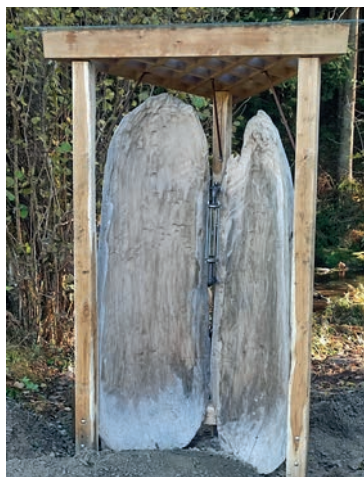
Die Muschel - eine Station am Gefühlsweg