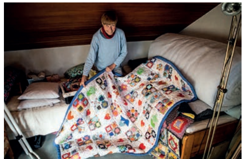
Auch große Decken fertigt sie als Patchwork