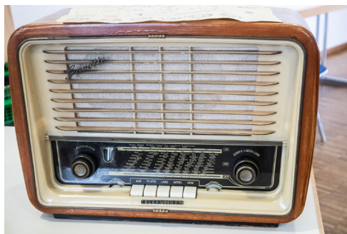
Das älteste Teil vor Ort