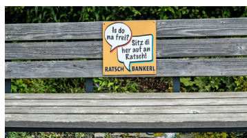
Eins der Ratschbankerl