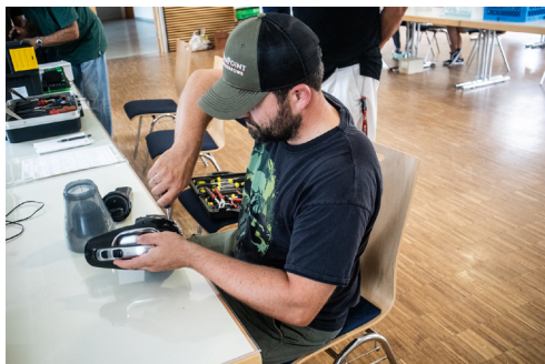
Einer der fleißigen Helfer

waren alle Stolpersteine aus dem Weg geräumt und an einem Mittwoch im Juli ging es los. Trotz des Badewetters war das Interesse groß. Vom Rasentrimmer bis zu einem 70 Jahre alten Radio war alles vertreten. Großgeräte werden nicht genommen, erklärte Martin Pichler. Man will doch den lokalen Elektrohändlern keine Konkurrenz machen. Die Reparaturen sind kostenlos. Nur benötigte Ersatzteile müssen von der Kundschaft bestellt werden. Diese müssen halt entscheiden, ob sie das Geld investieren wollen. Berechtigt ist die Frage warum das ganze Reparaturcafe heißt. Getränke und Kuchen stehen nämlich für alle Anwesenden kostenfrei parat. Spenden werden natürlich gerne angenommen, denn man muss bestimmt mal Material und Werkzeug ersetzen. Übrigens kommen kann jeder mit einem Gerät, selbst wenn er nicht aus Schönberg ist. Jeden zweiten Mittwoch im Monat von 16.00 bis 19.00 Uhr ist jetzt Reparaturzeit angesagt im KUK. Der Grundgedanke ist einfach; Es muss nicht einfach alles gleich auf dem Müll landen. Meistens sind es nur Kleinigkeiten und das Gerät funktioniert wieder. Eins der ersten Geräte im Cafe war ein Rasentrimmer, der nach einer halben Stunde Arbeit wieder neu zum Leben erwacht ist.