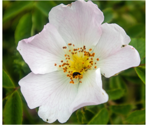
Die wilde Hundsrose