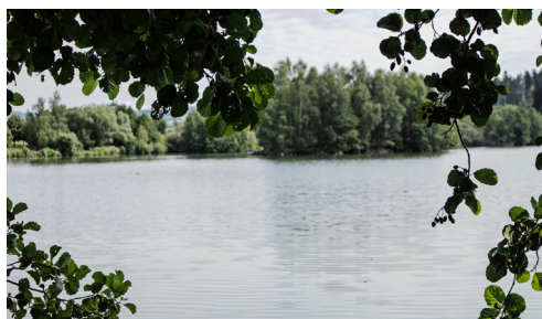
Blick auf den See

baden oder ein erfrischendes Bad, vieles ist hier am Erlauzwieseler See möglich. Nicht unerwähnt bleiben darf der Bienenlehrpfad, der am Rundweg zu finden ist. Das Restaurant am See sorgt für das leibliche Wohl der Besucher. Urlaubsgäste finden in dem nahen Ferienpark Jägerwiesen oder dem Waidlerland Feriendorf ein Domizil. Der See ist ein lebendiger Ort und bietet viele Möglichkeiten. Übrigens am Reichermühlbach selbst ist der Biber zu Hause. Das dort üppig wachsende Springkraut wird von einer Herde Wasserbüffel etwas ausgelichtet. Somit kann die Artenvielfalt in die einst tristen Feuchtwiesen am Bach zurückkehren.