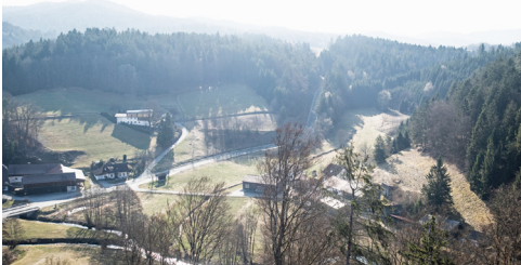
Aussicht von Burg Ranfels

Mit einer Geschichte, die bis ins 12. Jahrhundert zurückreicht, bietet diese Anlage einen Einblick in die Kulturlandschaft, die von der Burgherrschaft geprägt wurde. Erbaut wahrscheinlich von den Grafen von Formbach oder den Grafen von Neuburg, wurde die Burg Ranfels im Laufe der Jahrhunderte von verschiedenen Adelsfamilien besessen. Heute sind noch das Torgebäude und angrenzende Wohnbauten erhalten und der idyllische Burggarten im Innenhof ist frei zugänglich. Die ehemalige Schlosskapelle, dient bis heute als Pfarrkirche. Neben den erhaltenen Gebäudeteilen gibt es auch die Wunderkammer. Hier finden immer wieder Ausstellungen statt. Weitere Informationen findet man unter www.burg-ranfels.de Ein Rundweg um die Burg- und Kirchenanlage Ranfels führt entlang eines schmalen, jedoch gut gesicherten Steigs mit beeindruckenden Felsen und bietet atemberaubende Aussichten. Der Weg führt zurück zum Ausgangspunkt, wo man ins Innere der Burganlage gelangt. Der Weg kann durch Moos und feuchte Steine glatt werden.