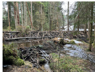
Biberdamm nahe Schöfweg

Besonders häufig sind die rührigen „Ökosystemmanager“ an allen größeren Gewässern zu finden. Wo das Wildtier bereits zu Beginn der Wiedereinbürgerung Fuß gefasst hat, wächst der Bestand inzwischen aber nicht mehr. Denn Biber sind extrem territorial. In einem Revier, das zwei Kilometer Uferlänge und mehr umfasst, wird nie mehr als eine Familie leben. Sie besteht maximal aus dem Elternpaar, den Jungen vom Vorjahr und dem aktuellen Nachwuchs. Das Vorkommen von Bibern auf einer bestimmten Fläche ist also streng begrenzt. Rivalen werden vehement vertrieben und dabei manchmal auch tödlich verletzt. Hinzu kommt, dass nur fünf Prozent der Landesfläche von Bayern überhaupt als Lebensraum für den Biber infrage kommen. Nur an den Rändern seiner Verbreitung, etwa im Voralpenraum oder in Ober- und Unterfranken, nimmt seine Zahl noch zu. Das belegt, dass das oben beschriebene rigide Reviersystem greift und eine „Übervermehrung“ der Bibers in Bayern verhindert.