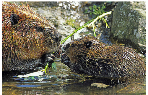
Bibermutter füttert Junges

Dass es in dem so dicht besiedelten Deutschland auch Konflikte zwischen Mensch und Biber geben würde, war den Experten vom BUND Naturschutz von Anfang an klar. Schon 1996 führte der BN deshalb ein erstes modellhaftes Bibermanagement im Raum Ingolstadt ein, das zwei Jahre später auf ganz Bayern ausgedehnt wurde. Zwei hauptamtliche Bibermanager sind seither quasi rund um die Uhr für die Verständigung zwischen Mensch und Tier unterwegs. Sie sorgen dafür, dass die Nachbarschaft gelingt, auch wenn es einmal Probleme gibt. Fundiertes Wissen, konkrete Hilfe und Schadensausgleich setzen sie übler Nachrede und Vorurteilen gegenüber dem Biber entgegen. Unterstützt werden sie dabei von Hunderten Freiwilligen aus den BN-Kreisgruppen und anderen Naturschutzverbänden, die sich ehrenamtlich und direkt vor Ort für den Rückkehrer einsetzen. (Texte stammen aus der Homepage des Bund Naturschutz und wurden leicht gekürzt )