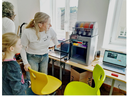
Der 3 D Drucker in der „Macherei“

Die im April eröffnete „Macherei“ in Thurmansbang zeigt genau wie man im Kleinen etwas bewirken kann. „Lernen, Gestalten, Ausprobieren und Zusammenarbeit“, lauter Werte, die schon früher von zentraler Bedeutung waren. Die „Macherei“ ist ein Ort, wo Kinder und Jugendliche einen Platz haben um ihre Kreativität auszuleben. Ein 3D-Drucker, Lasercutter, Papierplotter und anderes geben ihnen hier die Werkzeuge dafür. So können sie kreative handwerkliche Projekte selber gestalten. Gerade im Zeitalter der Smartphones und dem Wachsen der KI ist es wichtig zu lernen seine eigene Kreativität zu entwickeln und umzusetzen. Junge Menschen, die dies hier erleben, werden sicherlich als Erwachsene das weiter verfolgen. KI und Smartphone darf dem Menschen nicht eins seiner wichtigsten Möglichkeiten abnehmen und das ist seine Kreativität. Die Betreuerinnen in der Macherei arbeiten alle ehrenamtlich. Die Bücherei liegt genau gegenüber den Räumen der Macherei und ist damit eine wertvolle Ergänzung. Lesen fördert auch die Neugierde, eine weitere Triebfeder des Menschen. Das Förderprojekt „Macherei“ ist somit eine Ergänzung des lebendigen Ortsbildes neben Schule, Kindergarten und dem Cafe Maierei.