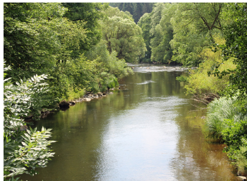
An der Ilz

Ob die Saußbachklamm oder an der Ilz. Diese letzten Wildwasser bieten nicht nur vielen Tieren und Pflanzen einen Lebensraum. Sie ermöglichen vielen Wandern die Natur zu genießen. In heißen Sommern ist das Kleinklima an Bächen viel angenehmer als ein Sonnenbad in der Hitze.