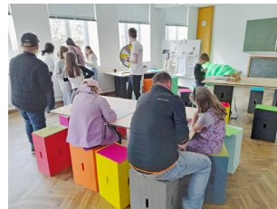
Großes Interesse bei der Eröffnung