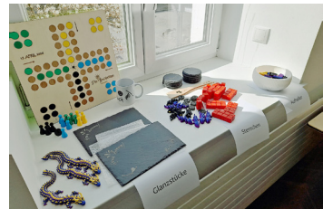
Arbeiten der jungen Menschen